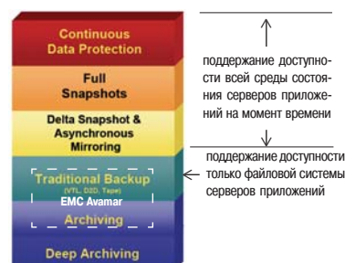
Рис. 1. В иерархии механизмов поддержания доступности приложений EMC Avamar занимает ниши традиционного бэкапа и активного архива.

При этом Avamar не заменяет (но может дополнять) технологии B2D, VTL (виртуальные ленточные библиотеки), копирование через WAFS/WDS-устройства (Wide Area Files Services/Wide Area Data Services) в тех ИТ-инфраструктурах, где это признано оправданным.